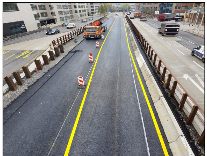
Hergestellter Straßenbau u. eingerichtete Verkehrsstufe 4