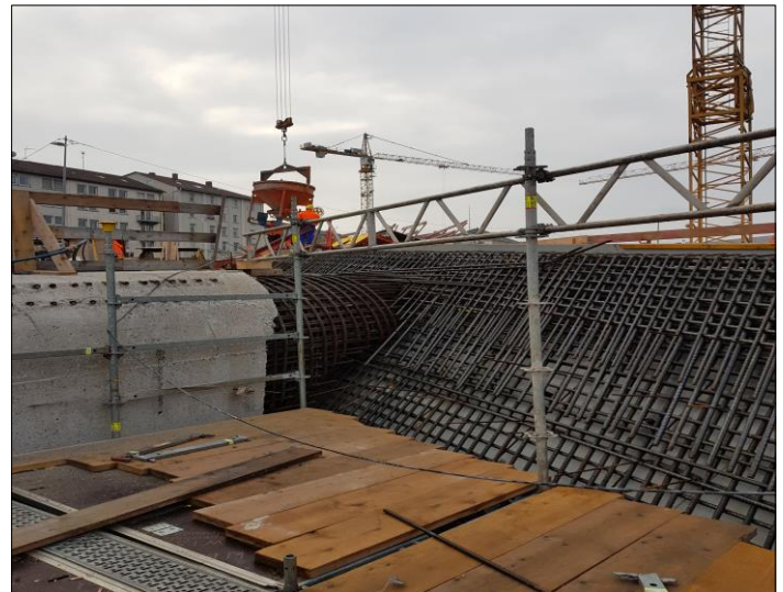
Herstellung d. Öffnungsschale u. Wände