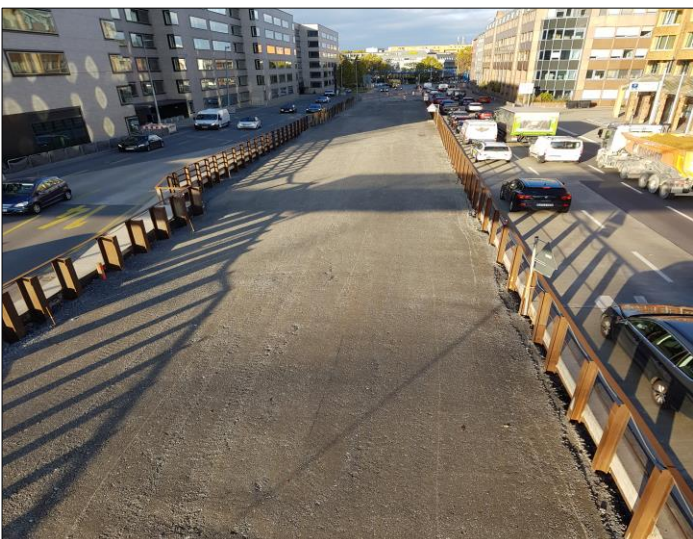
Herstellung Untergrund für Straßenbau d. Verkehrsstufe 4