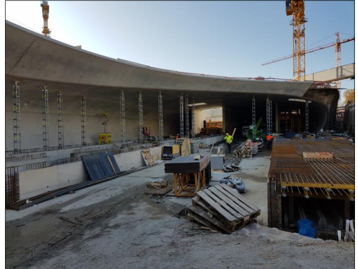
Herstellung d. Bahnsteige