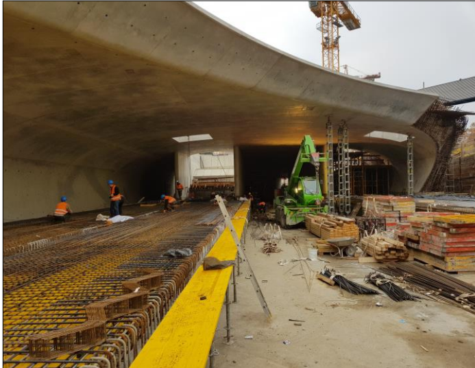
Herstellung d. Bahnsteige