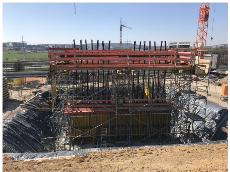
Herstellung der Zugwand Widerlager Nord Brücke A8