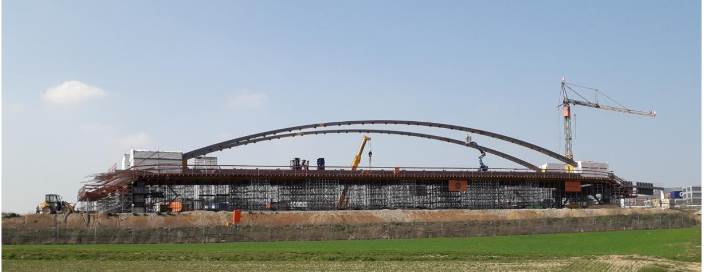
Freigestellter Bogen des Mittelfelds der Brücke A8