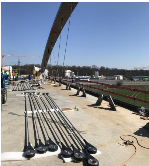
Einbau der Hänger für den Netzwerkbogen Brücke A8