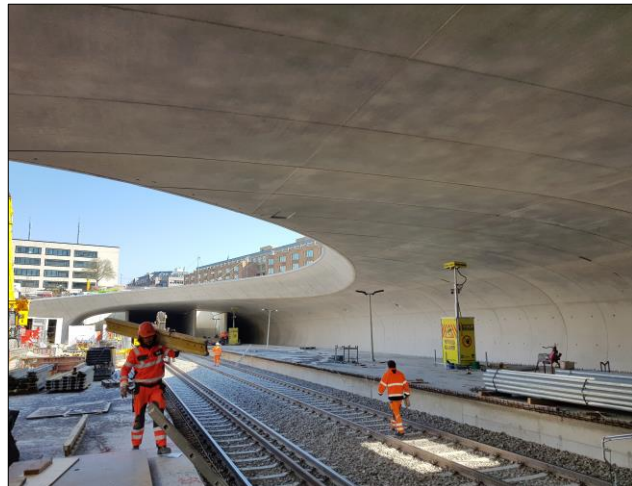
Blick auf die neue Haltestelle im Bereich des Schalendachs