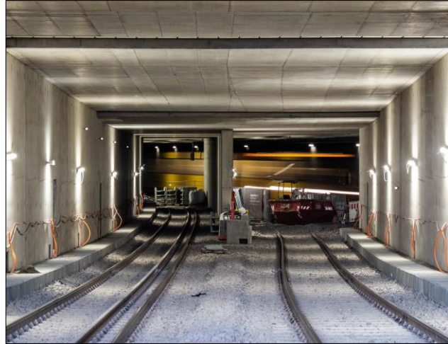
Blick in den neu hergestellten Tunnelabzweig