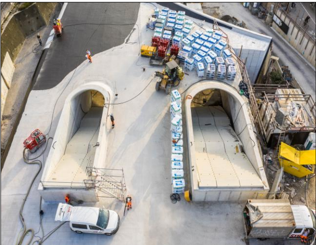
Treppengänge z. neuen Haltestelle Staatsgalerie