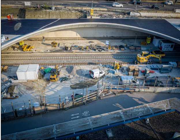
Blick auf den Bereich d. neuen Haltestelle