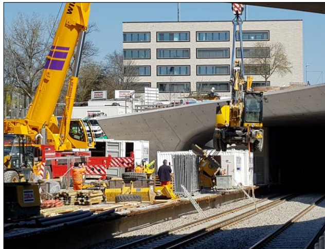
Umsetzen eines Zweivegbaggers