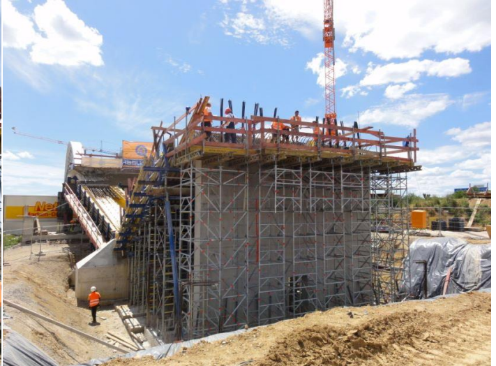
Brücke A8: Schalung und Bewehrungsarbeiten am Widerlager Süd