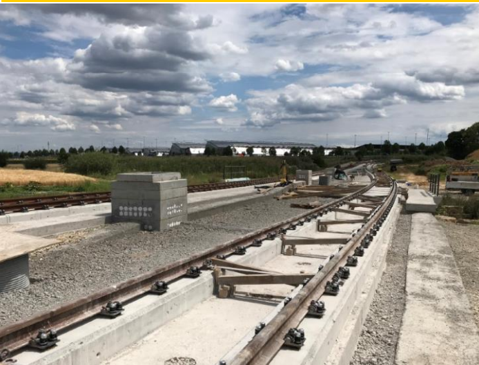
Blick in den fertigen Rohbau der Haltestelle Flughafen/Messe