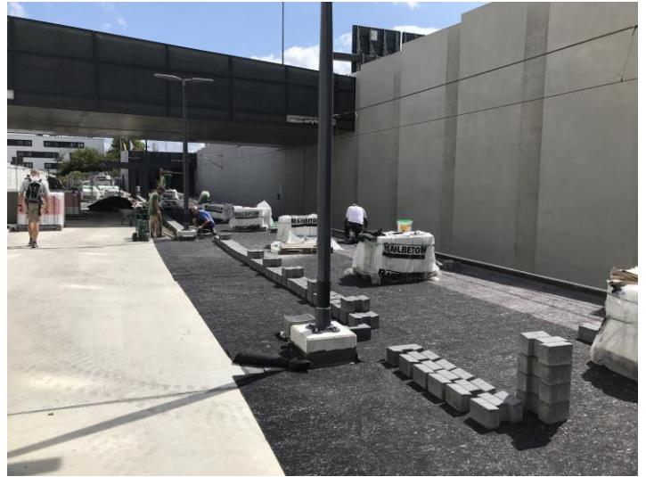
Haltestelle Flughafen/Messe - Start Belagsarbeiten Bahnsteig