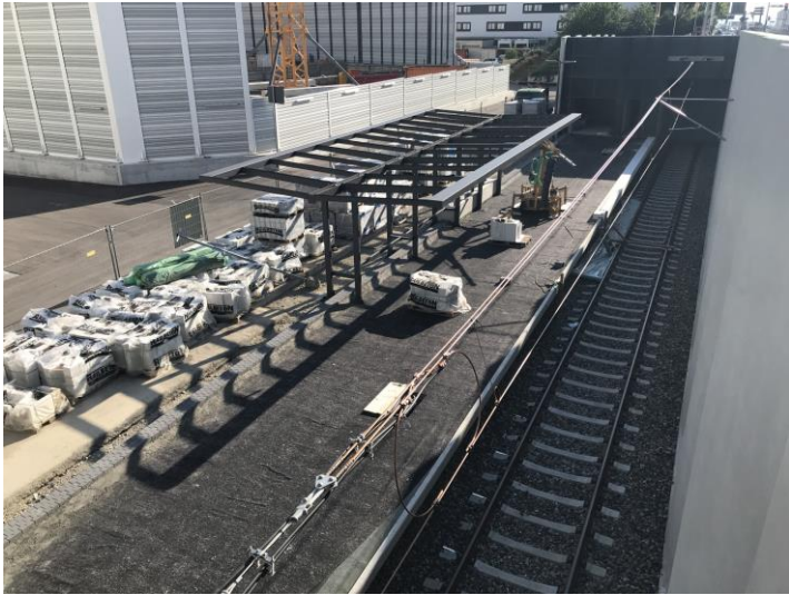
Haltestelle Flughafen/Messe - Start Belagsarbeiten Bahnsteig