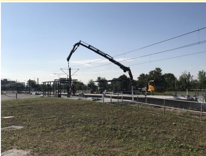
Montage der Wartehallen an der Hast. Messe West