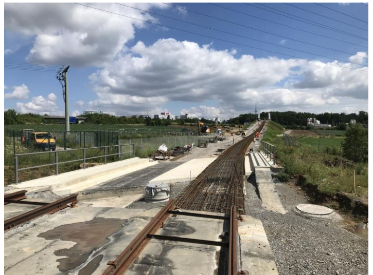
Die letzten 300m Streckengleis werden gebaut