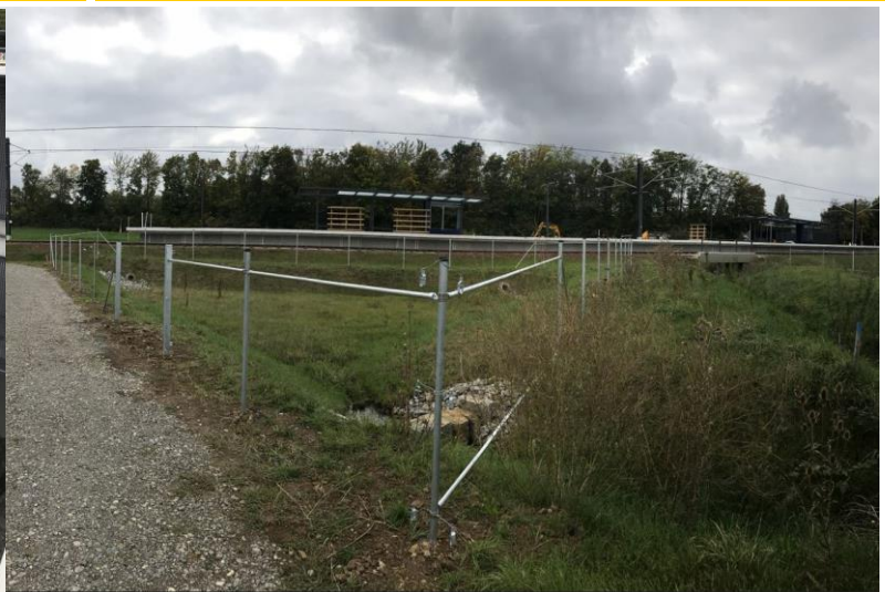
Ausbau der Betriebsräume Ost an der Endhaltestelle Flughafen/Messe